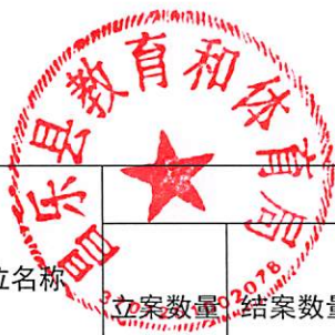
2. --昌乐县教育和体育局--(单位) 2021年度行政处罚情况统计表