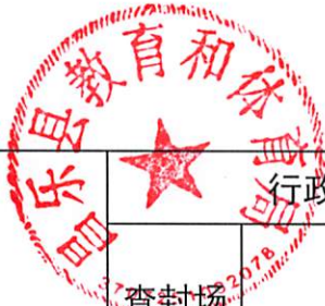
3. 昌乐县教育和体育局（单位）2021年度行政强制情况统计表